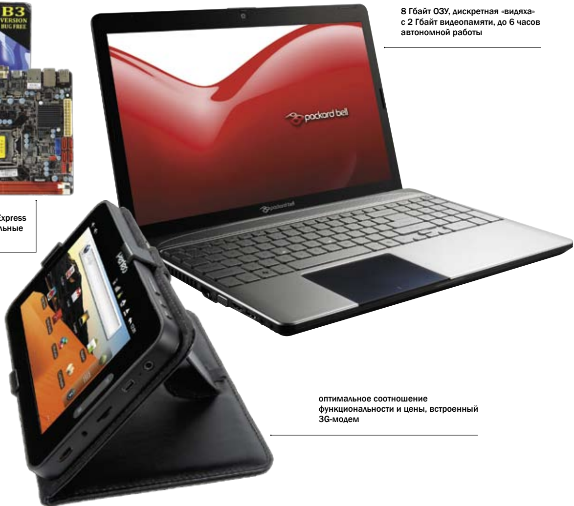
8 Гбайт ОЗУ, дискретная «видяха» с 2 Гбайт видеопам'яти, до 6 часов автономной работы