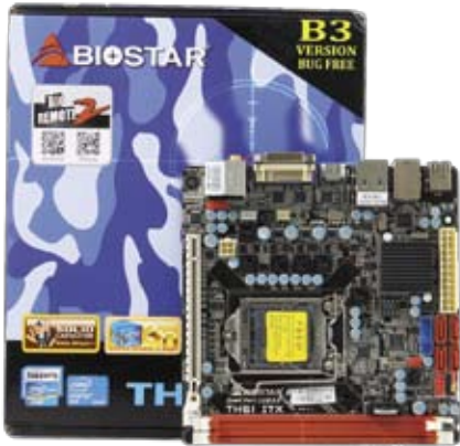
формфактор mini-ITX, слот PCI Express x16, до 16 Гбайт ОЗУ, все актуальные видеовыходы