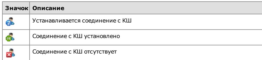
Табл.1 Значок программы аутентификации

Программа будет запущена. В системной области панели задач ОС Windows появится значок программы. Вид значка зависит от состояния подключения к КШ.